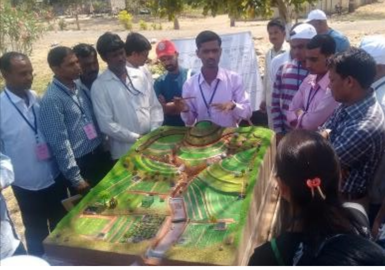
पानी फाउंडेशनच्या प्रशिक्षणात सहभागी ग्रामस्थ

चालू होत्या. ग्रामसेवक, कृषी सहाय्यक, तलाठी यांच्यामार्फत प्रवेश अर्ज गावागावांपर्यंत पोहचवून काम करणे सुरू होते.