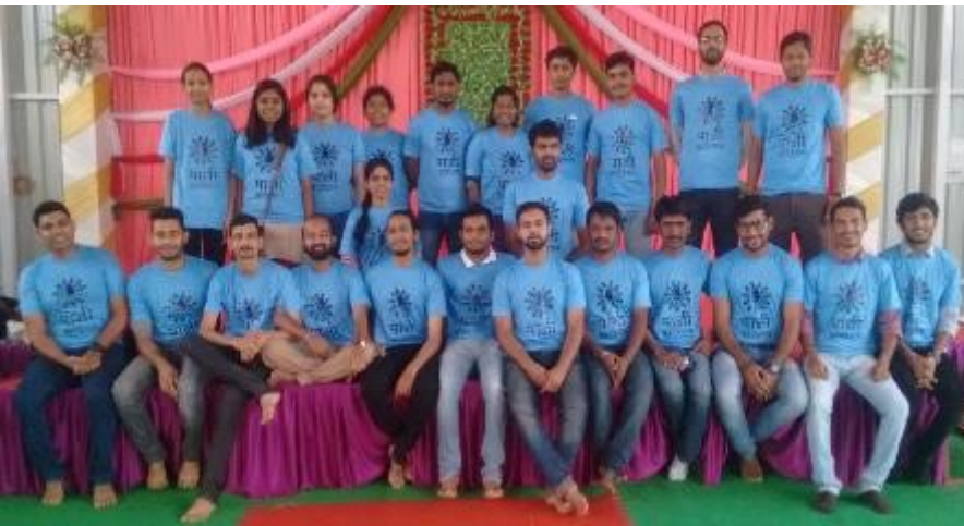
ग्रामसभा घेण्यासाठी मदतीला आलेले निर्माणी

४ दिवसांच्या प्रशिक्षणानंतर १५ जानेवारीपासून आम्ही आर्वी मध्येच राहायला गेलो. वॉटर कपमध्ये गावांनी सहभाग नोंदवण्यासाठी ३१ जानेवारी ही अंतिम तारीख होती. तहसील कार्यालयातून कळले की आर्वी तालुक्यात ७२ ग्रामपंचायतींमध्ये २२२ गावे आहेत. त्यातील १४० ही लोकवस्तीची, तर इतर गावे उजाड आहेत. कितीही धावपळ केली तरी आम्ही २ तालुका समन्वयक १५ दिवसांत १४० गावांपर्यंत पोहचून त्यांनी वॉटर कपमध्ये सहभाग घ्यावा म्हणून ग्रामसभा घेणे शक्य नव्हते. मग काय करावे?