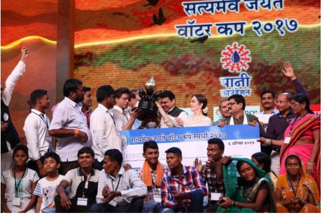
बालेवाडी येथे झालेल्या सोहळ्यात मुख्यमंत्री देवेंद्र फडणवीस हस्ते प्रथम क्रमांकाचे पारितोषिक स्वीकारताना काकडधरा गावचे ग्रामस्थ

काकडद-यासाठी सर्वात मोठे बक्षीस कोणते होते? प्रचंड कष्टाने निर्माण केलेली पाणी साठवण्याची क्षमता, त्यात साठलेले पाणी, ३० वर्षांनंतर पुन्हा ताकदीने एकत्र झालेले गाव, आणि “महाराष्ट्रात इतक्या उत्तम प्रतीचे एल.बी.एस. मी याआधी पाहिले नाही.” अशी पोपटराव पवारांनी दिलेली कौतुकाची थाप!